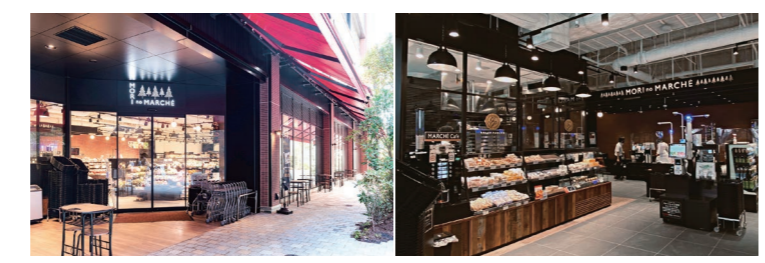
森のマルシェ グレース店

地元の新鮮野菜を生産する農業サービス会社や地元生産者とのコラボを推進。店舗での販売、ファーマーズマーケットでのイベント販売に加え、ファーム体験等へも取り組みを拡大しています。