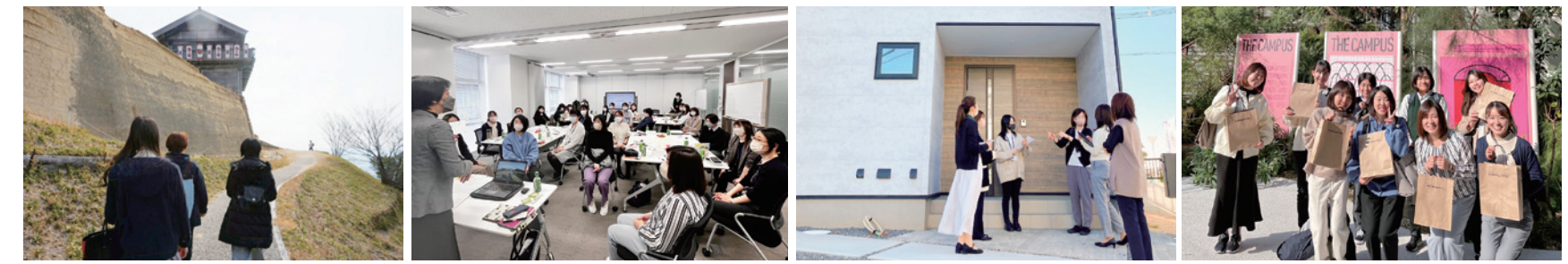
着地型ツアーの造成 KiraRi☆大女子会 in 東京 建売住宅見学 東京視察

〈主な活動内容〉 ・女性社員の意識改革・モチベーション向上を図る ・女性社員をキラリと輝かせる ・女性社員によるキラリと光る商品・企画の開発・提案活動